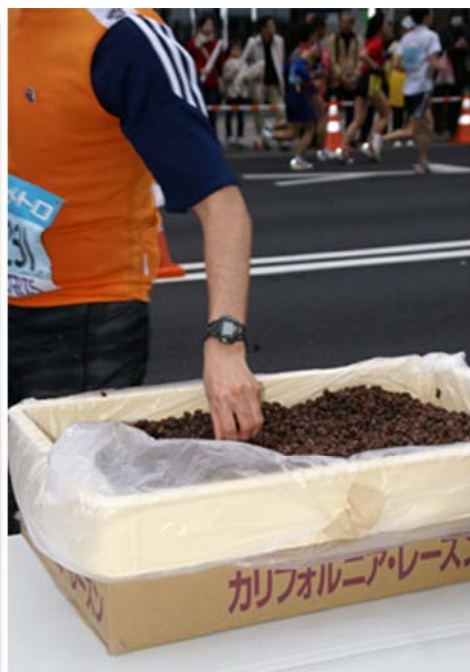
左:POP デザイン ① 右:「東京マラソン 2009」の給水所で配られたレーズン